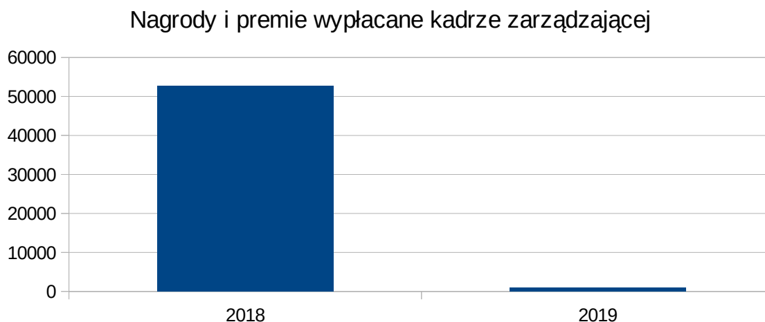
Wykres nr 3

Różnica ta została przedstawiona na wykresie nr 3.