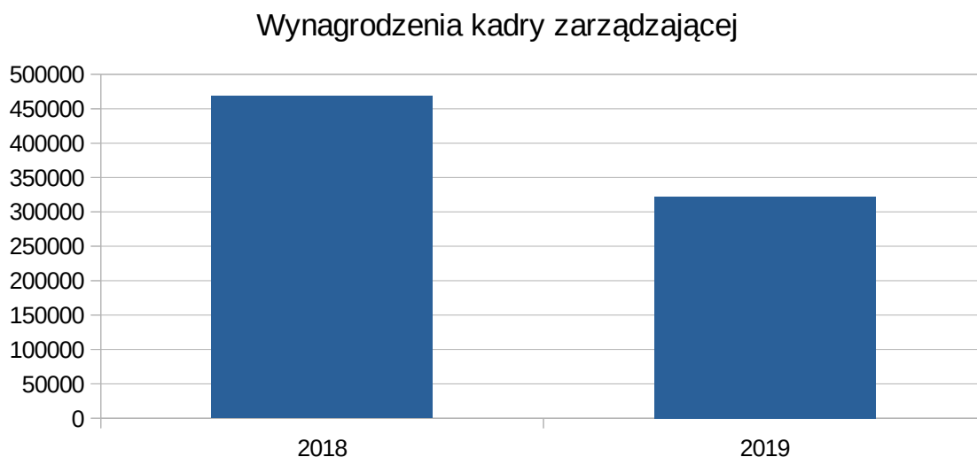
Wykres nr 2

Podobna sytuacja miała miejsce z pensjami kadry zarządzającej. Wygórowane wynagrodzenia, niemałe dodatki specjalne generowały znaczne koszty. W 2018 r. zarobki kadry zamykały się kwotą 468 161,60 zł, podczas gdy w 2019 r. była to już tylko kwota 322 178,55 zł – jest to spadek aż o 31%. Wielkości te zostały pokazane na wykresie nr 2.