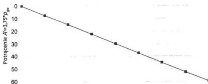
Rys. 1 Graficzne przedstawienie wartości parametru A'