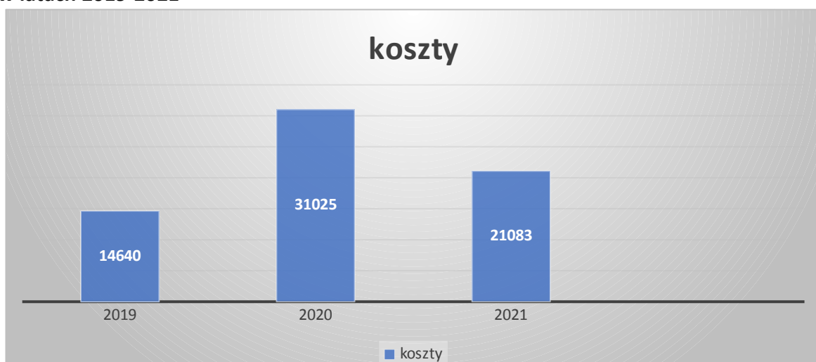
Wykres 2 Koszty ponoszone przez gminę Grunwald za pobyt dzieci w pieczy zastępczej w latach 2019-2021

Źródło: opracowanie własne na podstawie danych GOPS Grunwald